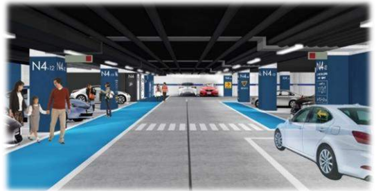
天神地下街北駐車場