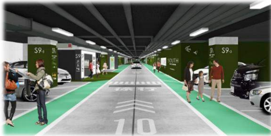
天神地下街南駐車場