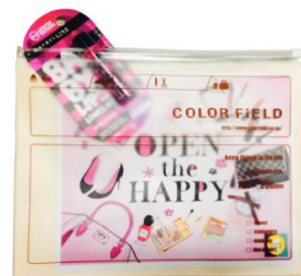
カラーフィールド