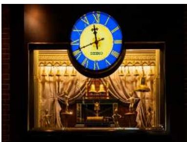
開業 10 周年を記念に設置された「からくり時計」

天神地下街のシンボルとして親しまれている「からくり時計（ヨーロッパンドリーム）」に、50 周年を記念した特別装飾を施します。半世紀の節目を祝う華やかな演出で、天神地下街全体に記念イヤーの彩りを添えます。