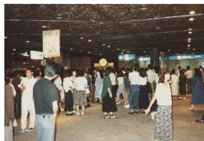
新たに設置されたからくり時計を見ようと多くのお客様でにぎわっている様子（天神地下街 10 周年当時の写真）