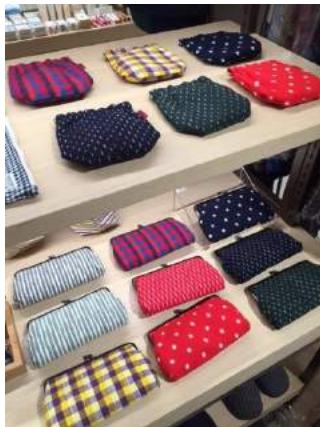
▲“久留米餅”のモダンな雑貨