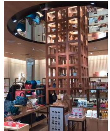
▲店内にそびえる日本の伝統 櫓装飾