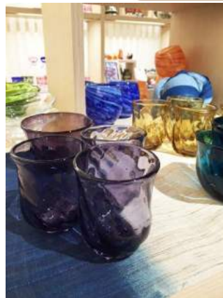
▲美しい“琉球ガラス”