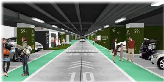
天神地下街南駐車場