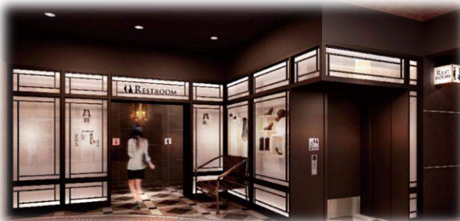
西6番街トイレ外観

※トイレ利用開始前の4月4日（月）13:00～17:00の間で内部の撮影等が可能でございますので、取材・撮影をご希望される方は下記〈問い合わせ先〉までご連絡をお願いいたします。