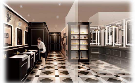
西6番街女性トイレ内