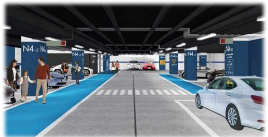
天神地下街北駐車場