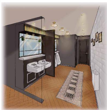
東 2 番街男性トイレ内