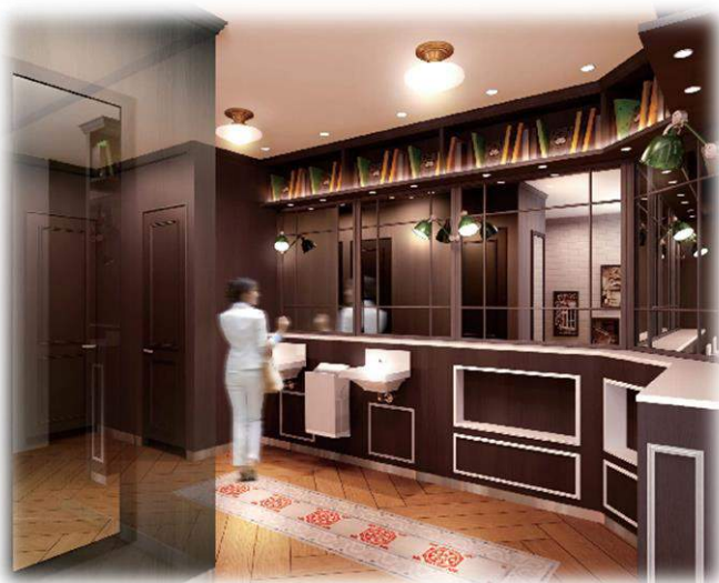
東 2 番街女性トイレ内