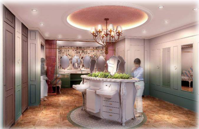
東 10 番街（女性専用）トイレ内部

今回、その第一弾として、東 10 番街の女性専用トイレのリニューアル工事が終了しましたので、お知らせいたします。