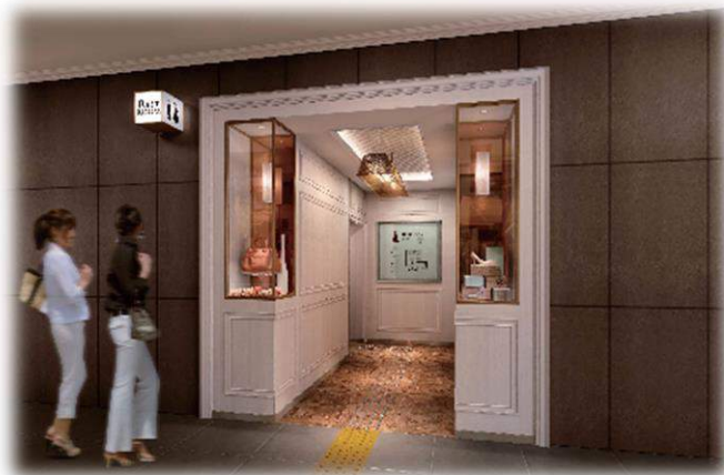
東 10 番街（女性専用）トイレファサード