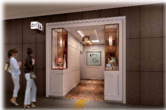
東 10 番街（女性専用）トイレファサード