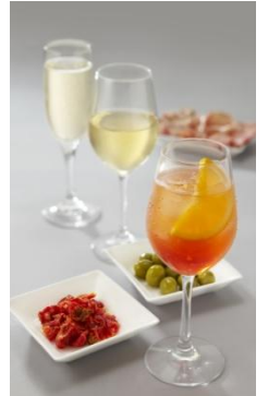
▲「アペリティーヴォ」とは食前酒の意味。アルコールも楽しめるアペリティーヴォタイムは17:00から。