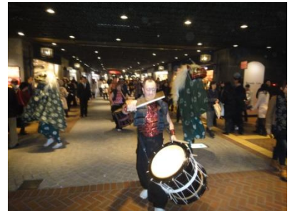
▲獅子舞が地下街を練り歩く姿は圧巻です！