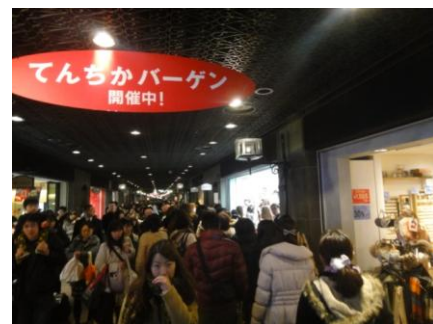
▲昨年の冬のバーゲンにて大賑わいの模様

更に、1/18(土)には、天神地下街の玄関口ともいえるインフォメーション広場に ニューショップがオープン 致します。機会がございましたらご紹介を宜しくお願い致します。