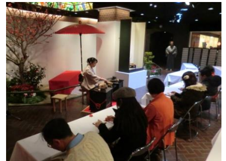
▲本格的な日本庭園にてお手前を見ながら抹茶とお菓子をお召し上がりいただけます。

200円で茶道裏千家のお手前で抹茶と和菓子をお召し上がりいただけます。収益は社会貢献等に役立て頂こう、寄贈致します。お正月からゆっくりと、お茶をいただきながら、チャリティに参加ができる心も体も温まるイベントです。どなたでもご参加いただけますので、お買い物のご休憩にどうぞ♪ (寄贈先:西日本新聞民生事業団)