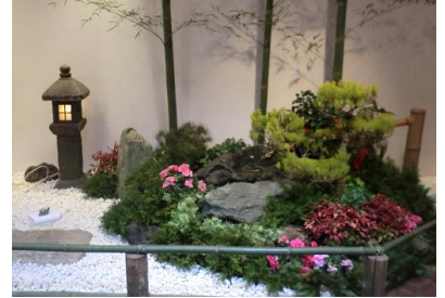
▲昨年の迎春庭の一角。

天神地下街に新春を告げる日本庭園が期間限定で登場！縁起が良いとされる松・竹・梅を配し、つくばいからは水も流れる本格的な日本庭園です。観覧無料。ぜひお気軽にお立ち寄りください。